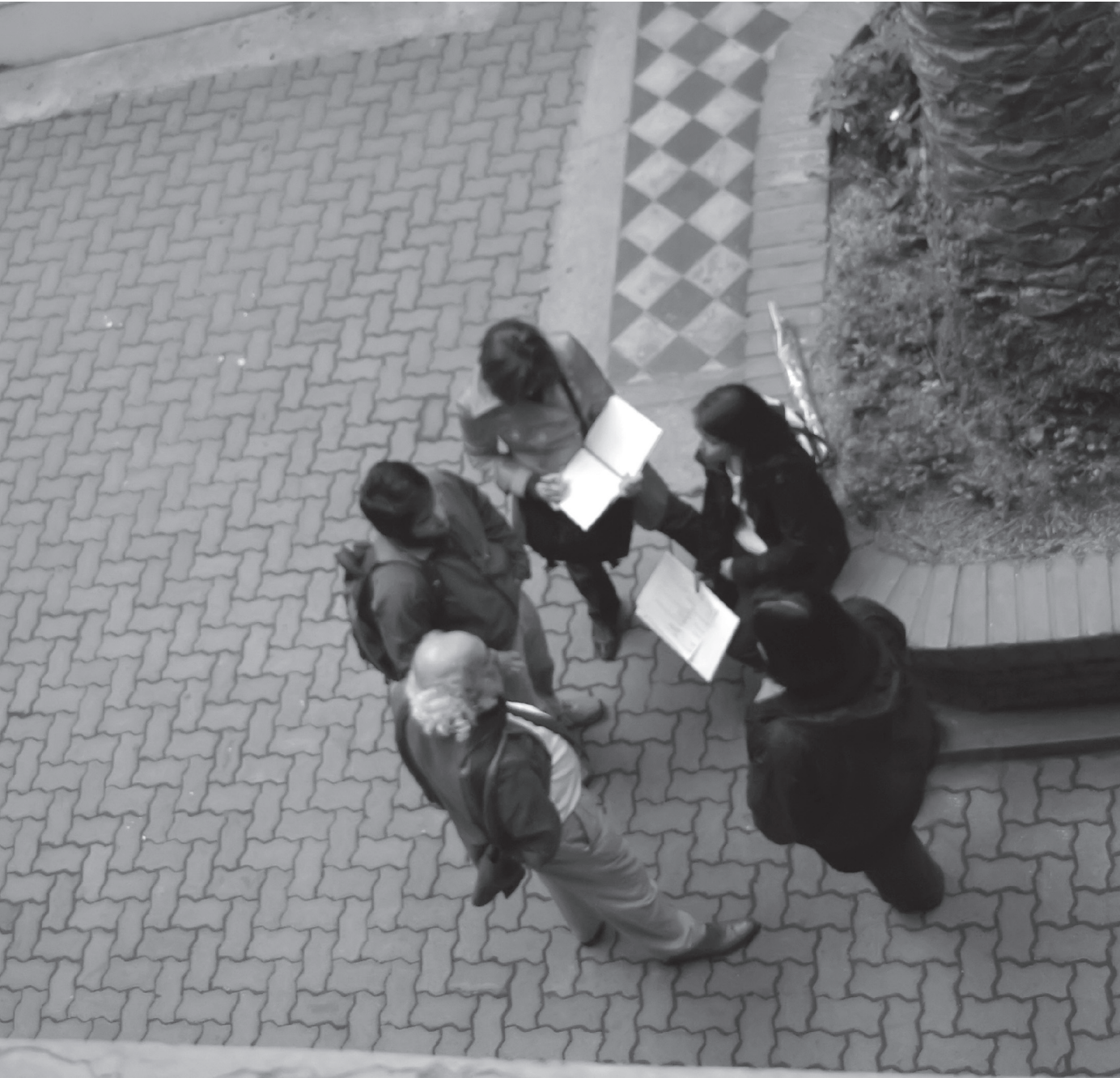
Reunión de planificación del equipo de emprendEducador .